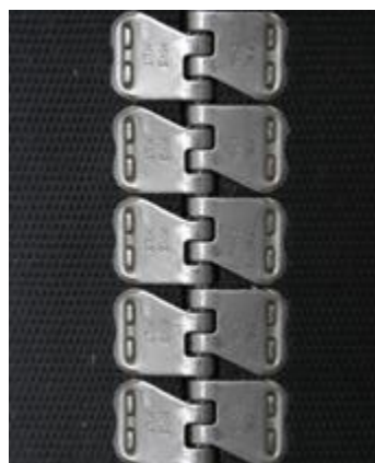
Соединение Mini Record верхняя часть