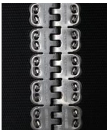
Соединение Mini Record нижняя часть